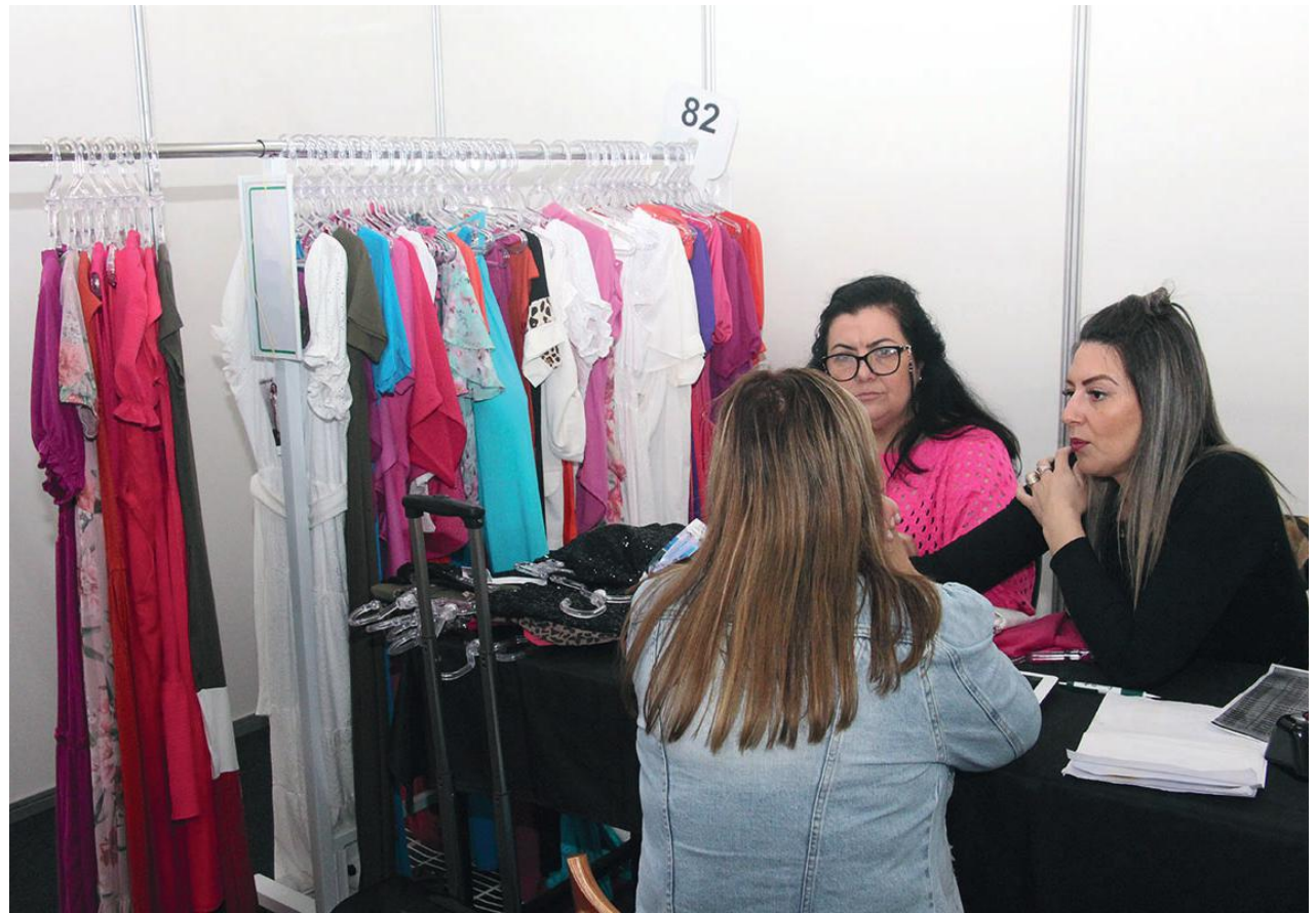
Ao todo 320 lojistas, que representam mais de 700 compradores de diversas partes do país já confirmaram presença no evento

O evento acontece no Pavilhão da Fenarreco, em uma área de 4 mil m², showroom com peças dos 150 fabricantes, estrutura de sala vip, mais de 150 box disponíveis para negociação dos clientes, bem como alimentação inclusa aos participantes em todos os dias do evento. “As edições da Pronegocio sempre são pensadas para receber, acolher e facilitar o acesso dos compradores às negociações diretas com os fornecedores. Assim, desejamos a todos os participantes desta edição uma excelente semana de nego-