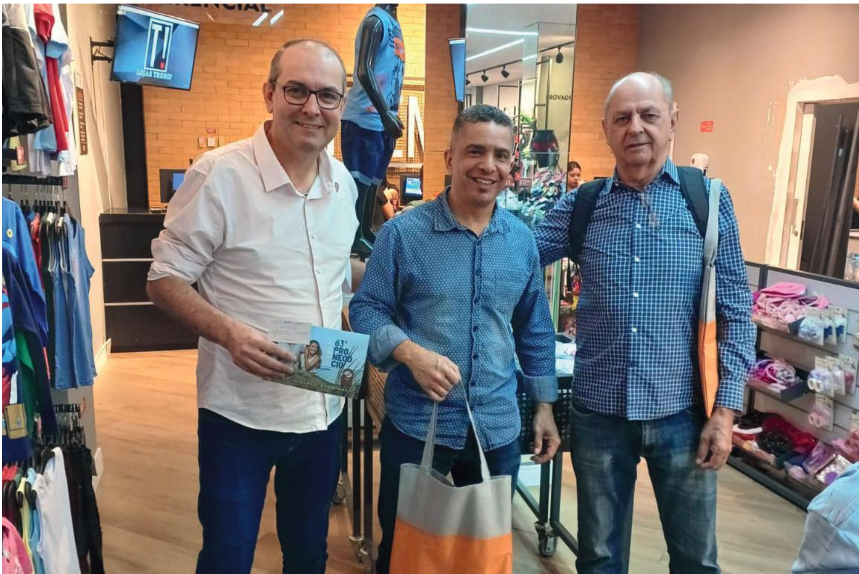
A primeira prospecção de compradores voltada para a 63ª Pronegocio foi para a região de Campinas