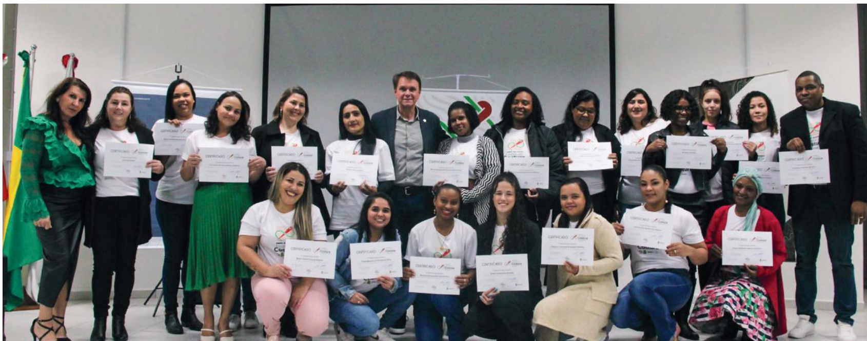
Alguns dos formandos desta edição da Escola de Costura da AmpeBr. Ao todo, 754 pessoas já concluíram o curso