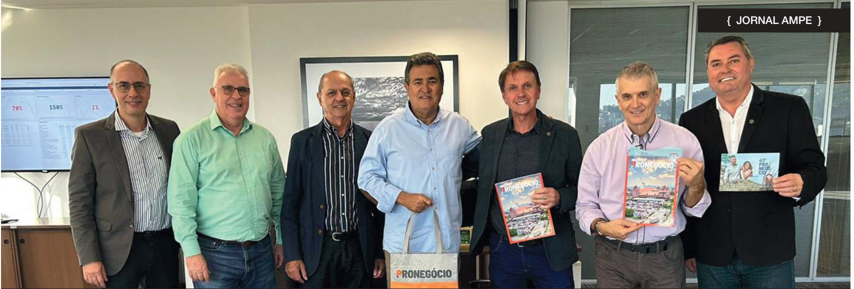
O encontro estreitou o relacionamento das entidades e discutiu futuras parcerias