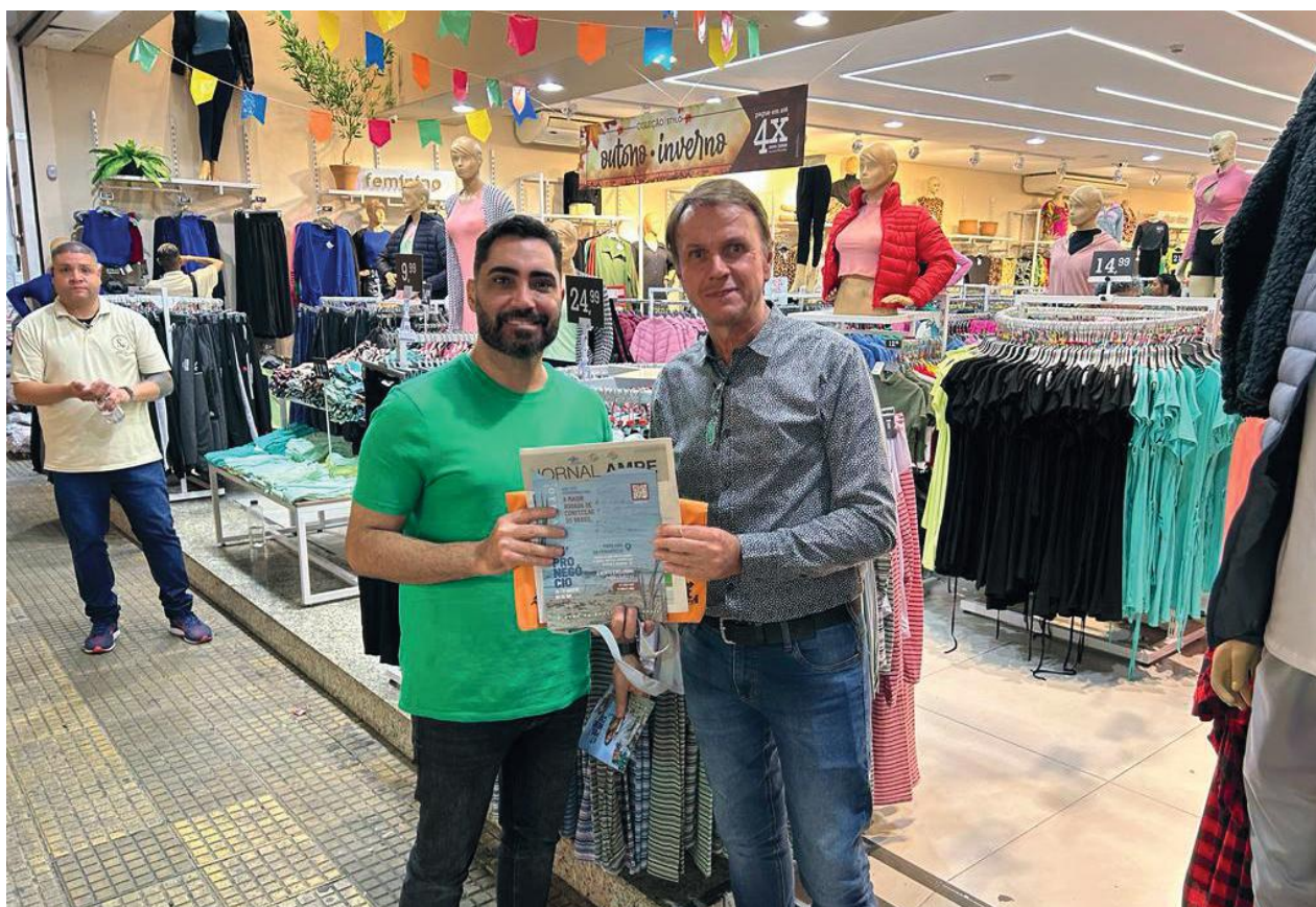
O interior norte de São Paulo foi outro destino dos diretores da AmpeBr, que convidaram novos lojistas para estarem presentes na rodada

vite a lojistas para participarem da próxima edição da rodada, no mês de agosto.