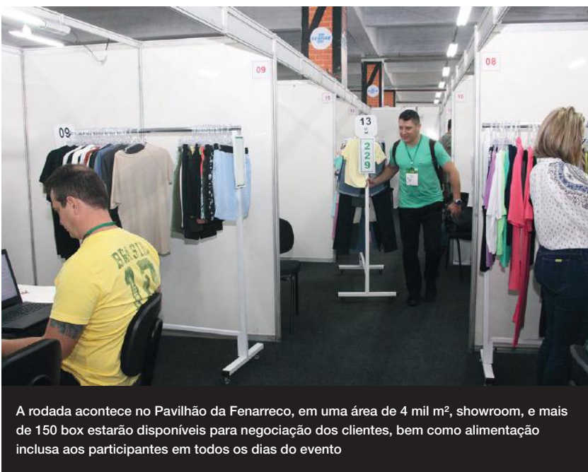
A rodada acontece no Pavilhão da Fenarreco, em uma área de 4 mil m², showroom, e mais de 150 box estarão disponíveis para negociação dos clientes, bem como alimentação inclusa aos participantes em todos os dias do evento