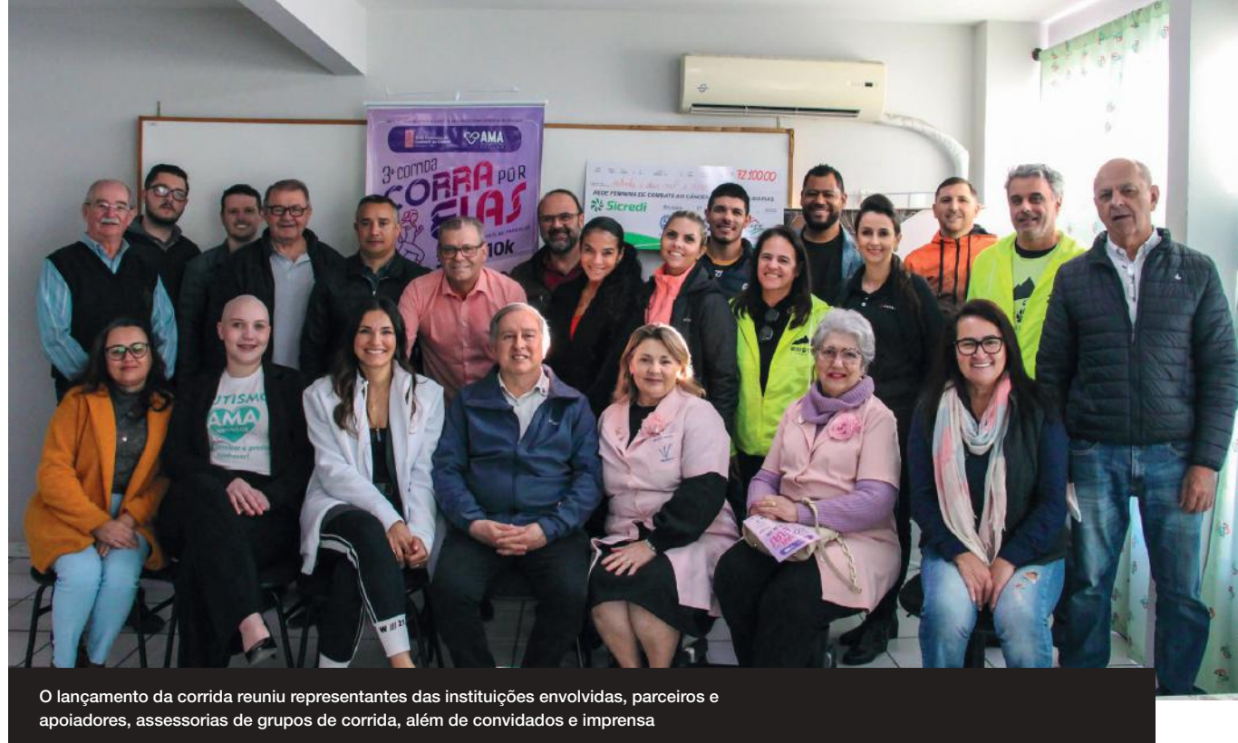
O lançamento da corrida reuniu representantes das instituições envolvidas, parceiros e apoiadores, assessorias de grupos de corrida, além de convidados e imprensa

“A AmpeBr se sente honrada em, mais uma vez, em parceria com as demais entidades, realizar a 3ª edição desta corrida, que é 100% solidária e